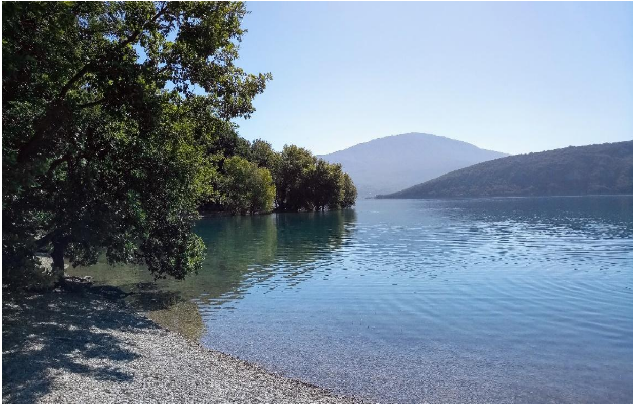
Lac St. Croix de Verdon